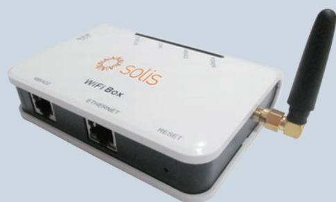
Datalogging box DLB